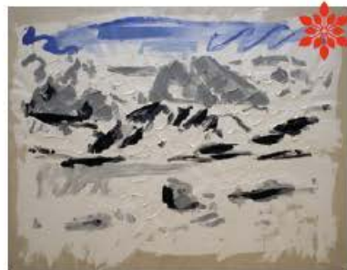
Christian LINDOW, Berg 1/1 (Montagne 1/1), 1981

DU 27 FÉVRIER AU 23 MARS DU LUNDI AU VENDREDI DE 9 H À 12 H 30 ET DE 13 H 30 À 17 H. ENTRÉE GRATUITE à l'ancienne bibliothèque Prémol 7 rue Henry Duhamel Réalisée par la Ville de Grenoble www.museedegrenoble.fr